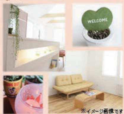
※イメージ画像です

建物面積: 117.58㎡ (35.50坪) 吹き抜け含まず 土地面積: 296.40㎡ (89.48坪)